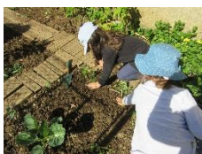
Horta e canteiros

Para fomentar e promover o respeito e conhecimento pela biodiversidade foram realizadas diversas atividades: