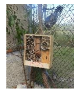
Hotéis de Insetos

E fizeram-se pesquisas e atividades sobre a biodiversidade animal das quais são exemplo um livro em três dimensões com algumas das espécies encontradas