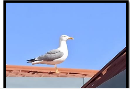
Gaivota no telhado do nosso pátio coberto à espera de "calmaria" para comer os restos.

As gaivotas-de-patas-amarelas vivem, geralmente em praias costeiras. Nomeadamente as portuguesas, apresentado um elevado número de espécie. A sua elevada reprodução tem vindo a afetar outras aves, pois as gaivotas-de-patas-amarelas alimentam-se de outras que ainda estão em desenvolvimento, afetando a sua evolução e diminuindo o número da sua espécie.