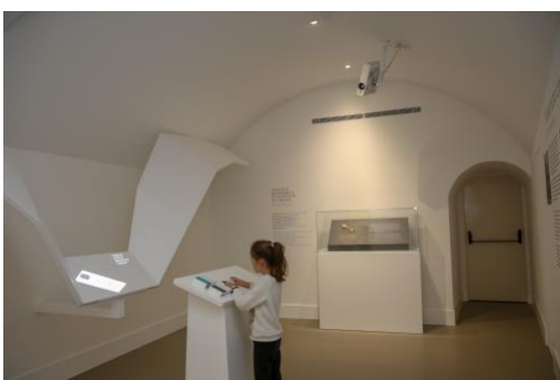
Um das salas do Museu da Vila onde há dispositivos interativos com formato de asas de gaivota

Informações retiradas de: https://www.atlasavesmarinhas.pt/gaivota-de-patas-amarelas/ https://visao.sapo.pt/visaose7e/sair/2020-02-15-no-museu-da-vila-em-cascais-viaja-se-entre-pescadores-reis-e-espioes/