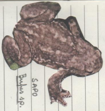
Sapo Bufo sp.