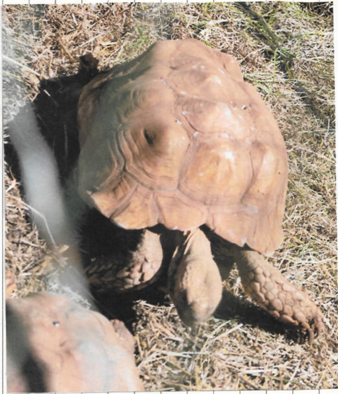
Tartaruga-boba "Caretta caretta" ou "Tartaruga-comum" É a espécie mais frequente e que existe com maior abundância na ilha da Madeira.