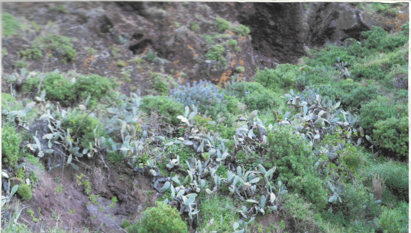
"Echium Candicans", ou "Orgulho da Madeira", ou "Massaroco" É uma planta endémica da ilha composta por uma massaroco de flores roxas. Surge em espécies nas zonas montanhosas e rochosas, por vezes cercadas de outras espécies como cactos.