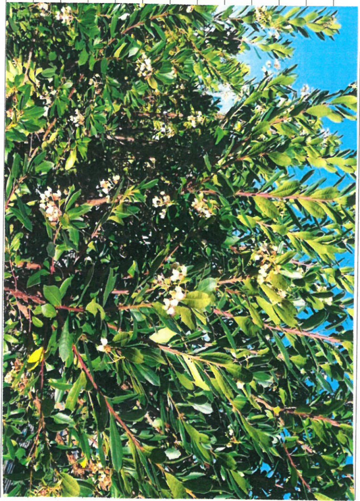
Medronheiro ( Arbutus unedo )