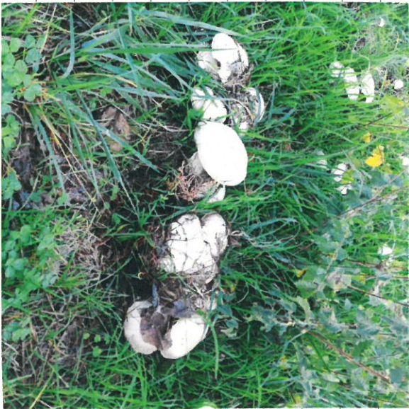
Fungos na passagem do outono pela nossa floresta.