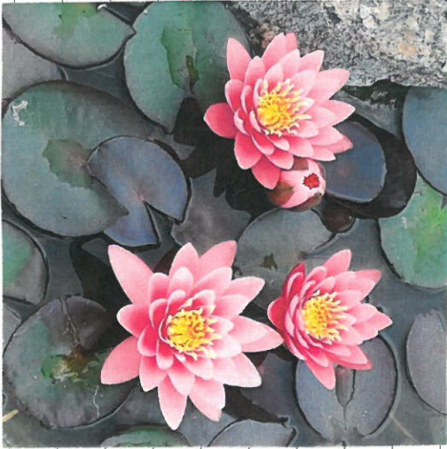
Nenúfares ( Nymphaeaceae )