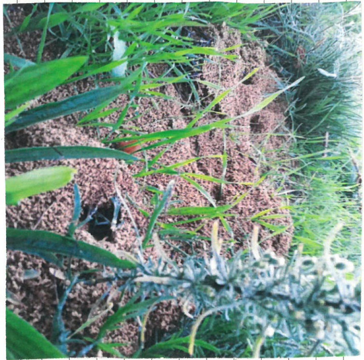
Montículos resultantes da atividade de formigas.