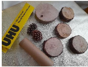
Fig. Nº 2 – Material para a escultura do mocho

Com base na imagem número 1, fizemos a recolha dos materiais a usar para por em prática o nosso mocho.