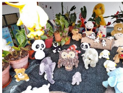
Fig. Nº 3 – divulgação da escultura

Como forma de divulgar o nosso trabalho para a comunidade educativa, optamos por colocar num espaço da floresta, que criamos com os peluches das crianças. Este espaço é um espaço muito observado pelas crianças e pelos pais quando vêm trazer os filhos à escola.