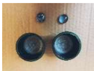
Olhos do mocho