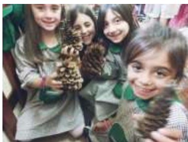
Fragmentos de pinhas