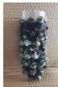
Asas do mocho