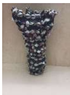
Corpo do mocho