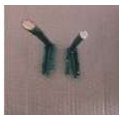
Patas do mocho