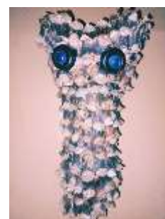
Corpo do mocho