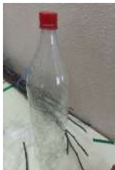
Garrafa de plástico