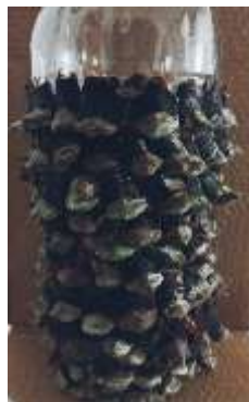
Corpo do mocho