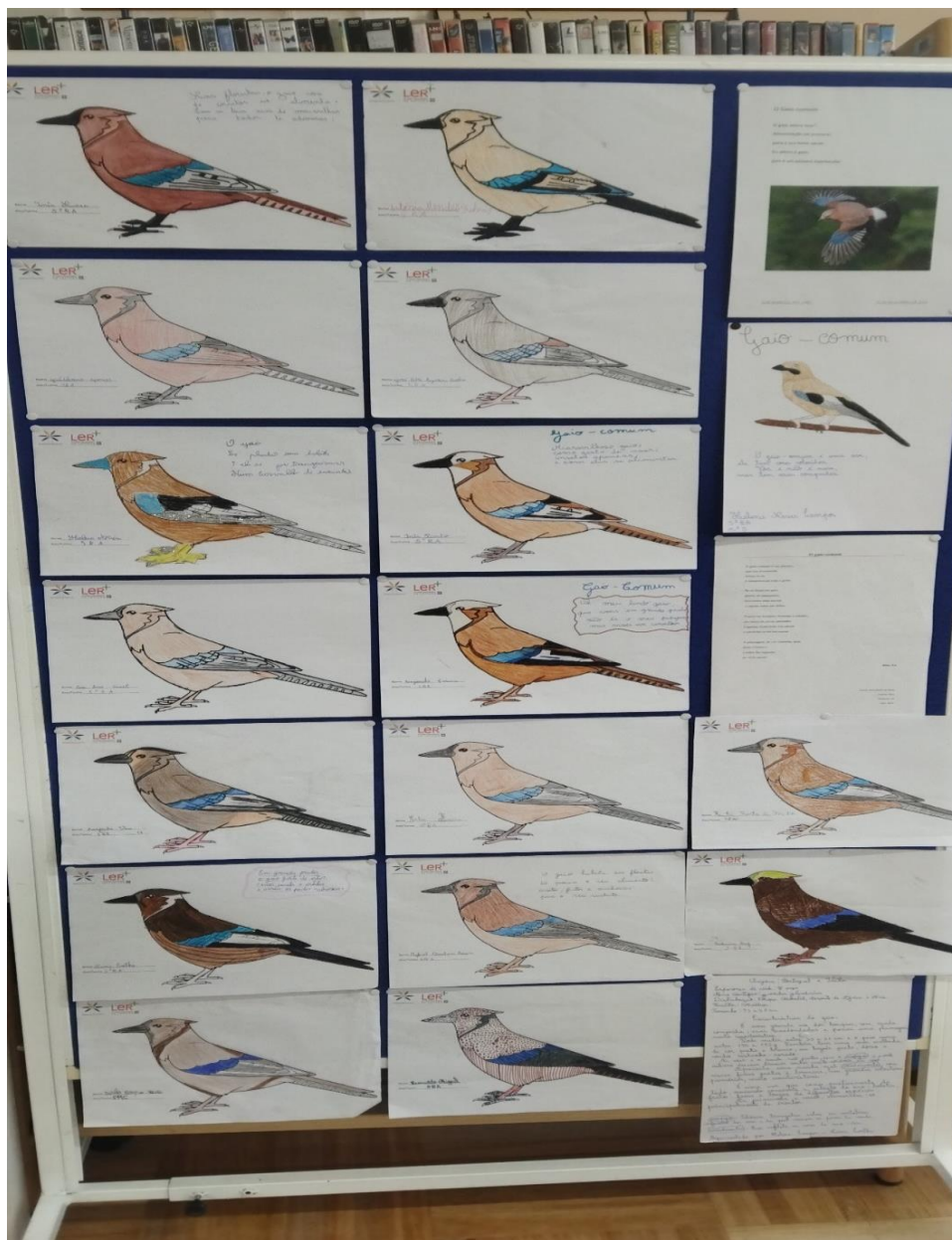
Exposição de trabalhos na biblioteca escolar dos alunos do 5º ano, das turmas A, B e C.