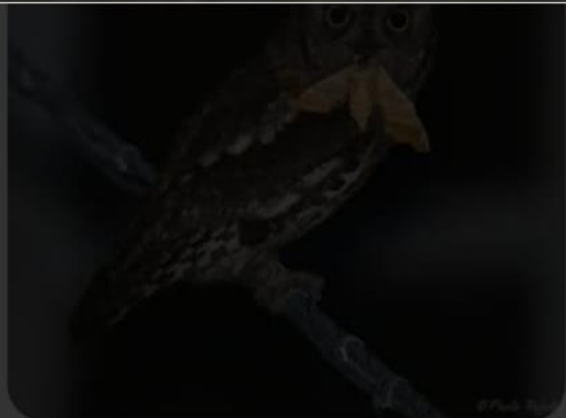
BioDiversity4All Mocho-d'orelhas (Otus sc...