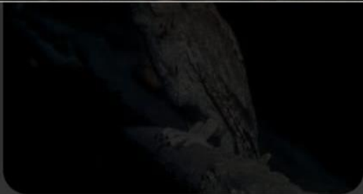
BioDiversity4All Mocho-d'orelhas (Otus sc...