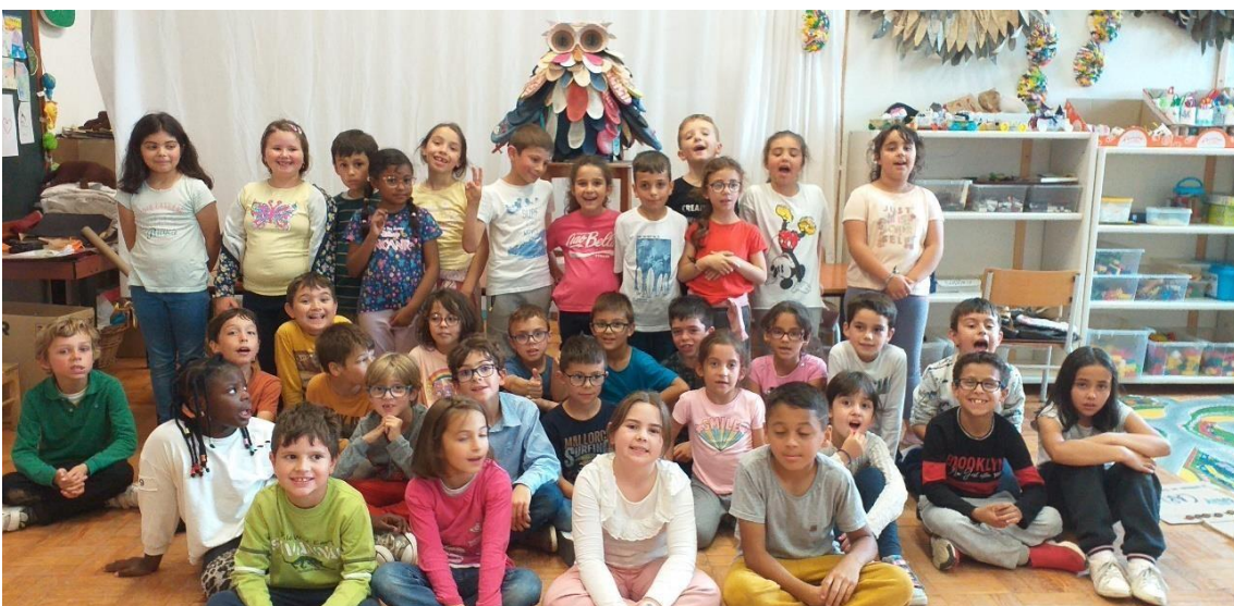
Alunos que desenvolveram o projeto. 2º Ano, turma A e B

Desejamos que todos tenham, a cada chinelo calçado “empatia” pelo ambiente!