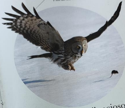
As penas das asas terminam em finos filamentos, para abafarem o som dos seus batimentos

Os caçadores em espaço aberto têm de ser rápidos para capturarem as presas. O mais rápido é o falção-peregrino, que caça outras aves atingindo-as em voo picado a grande velocidade. O marlin-azul é um dos caçadores aquáticos solitários mais rápidos do mundo, e a chita é o seu equivalente em terra.