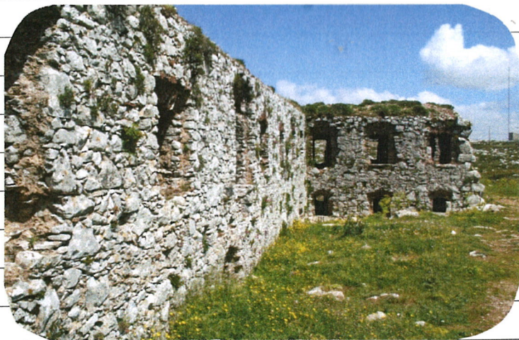
△ Ruínas do castelo dos Romanos

A Serra, área protegida de ambiente regional, situa-se a 50 Km a Nordeste de Lisboa. Está dividida administrativamente entre os concelhos de Loures e Alentejo.