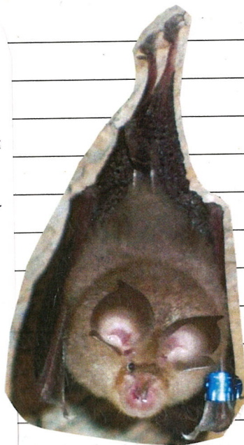
Rhinolophus auriculatus MORCEGO FERRADURA DO MEDITERRANEO