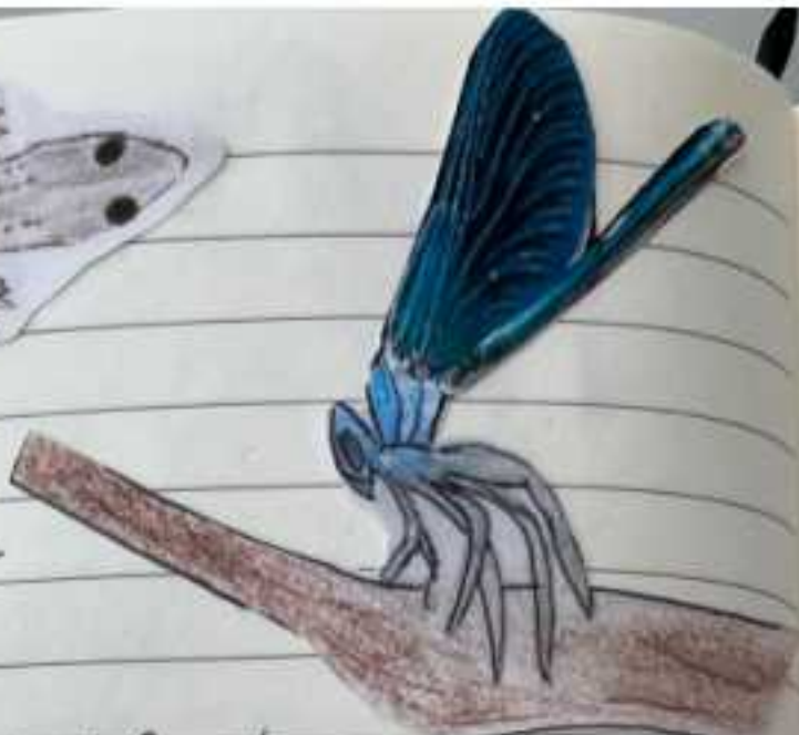
Calopteryx virga (Gaitheiro azul)