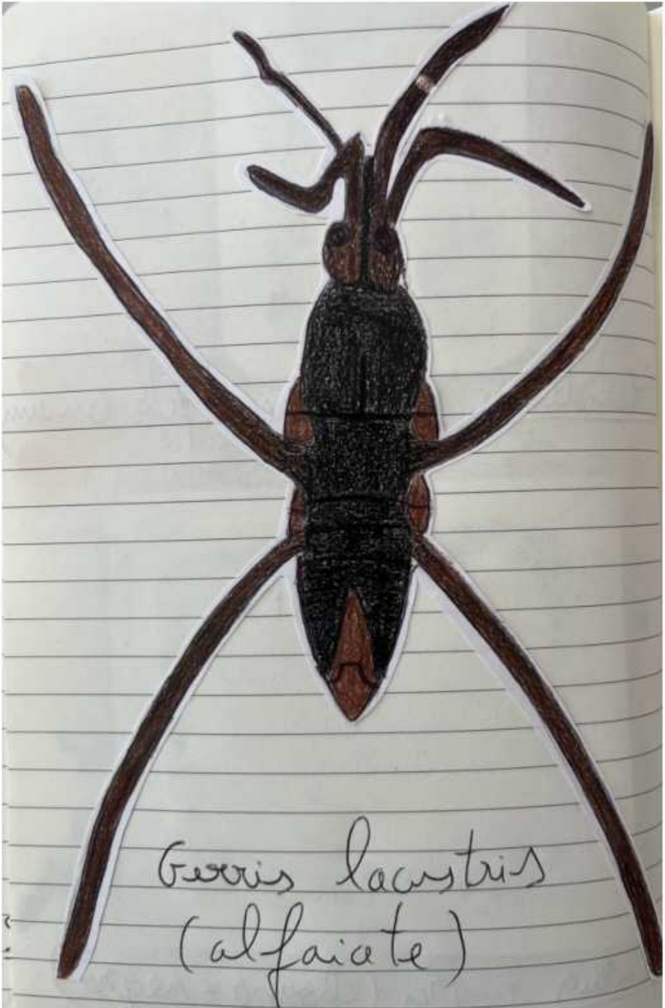
Georis lacustris (alfaiate)