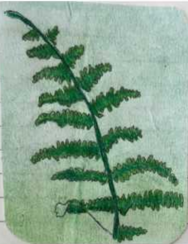
Pteridium aquilinum (feto-branco)