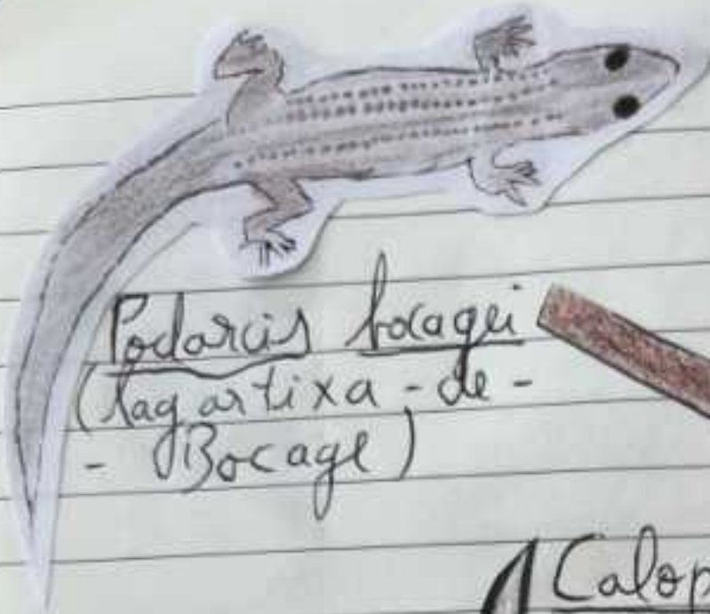
Podarcis bocagei (lagartixa-de- -Bocage)