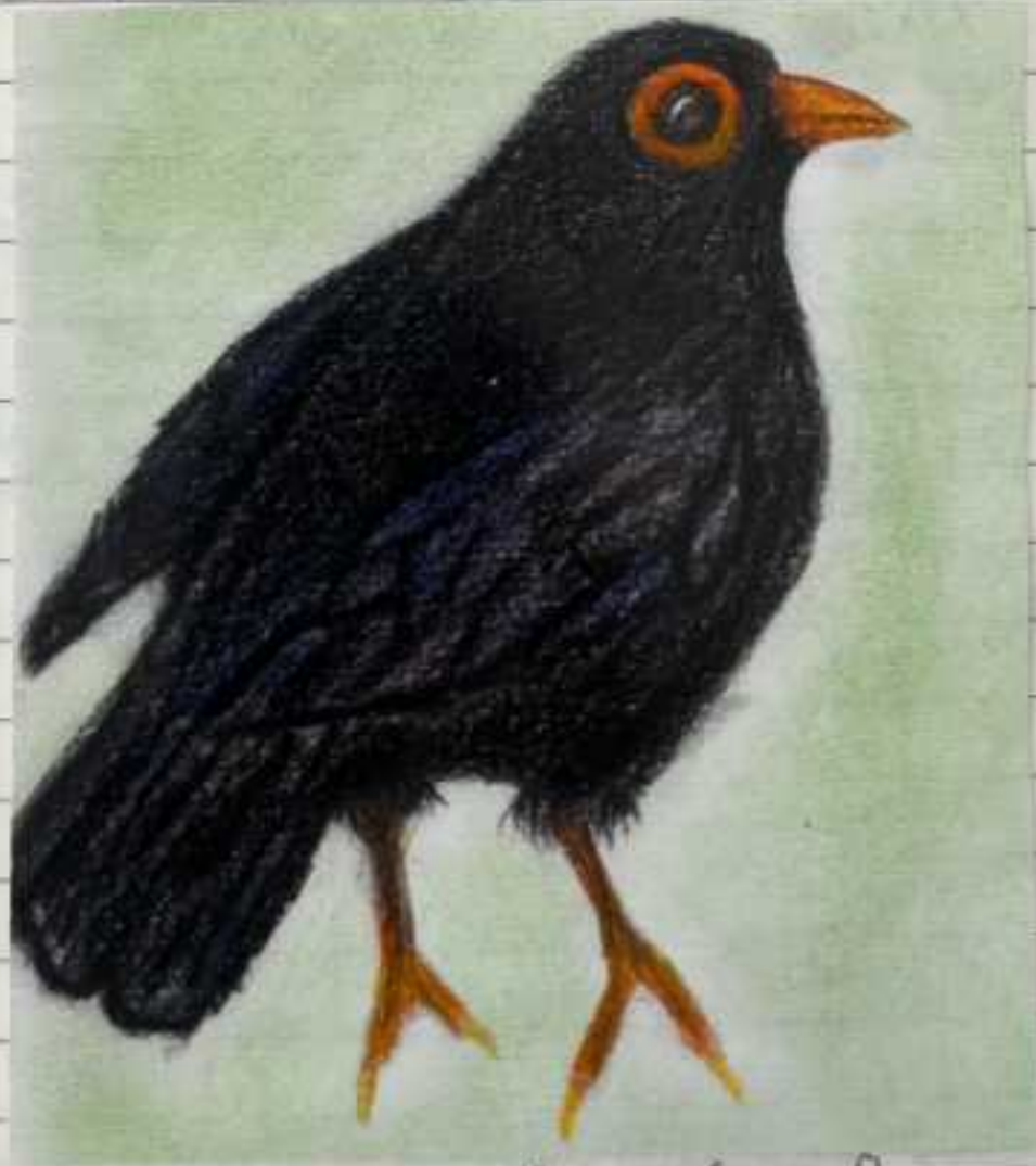
Turdus merula (melro-preto)