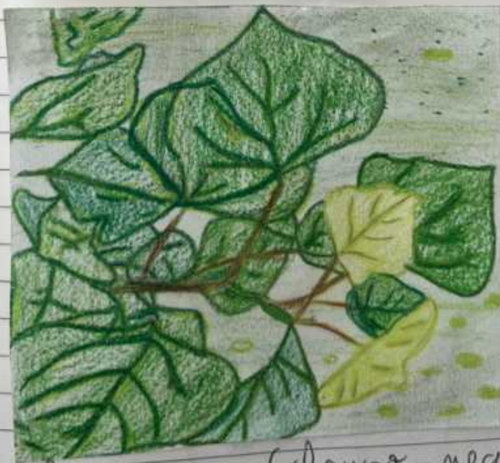
Populus nigra (choupo-negro)