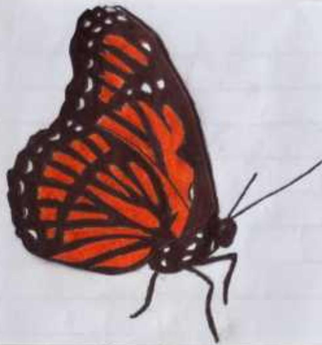
Vanessa atalanta (almirante-vermelho)