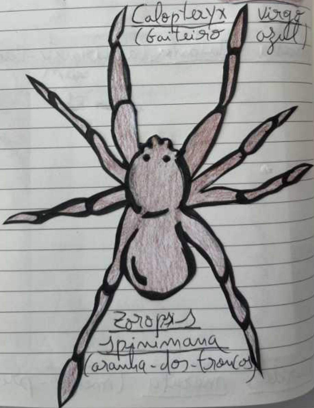
Zoropsis spinimana (aranha-dos-troucos)