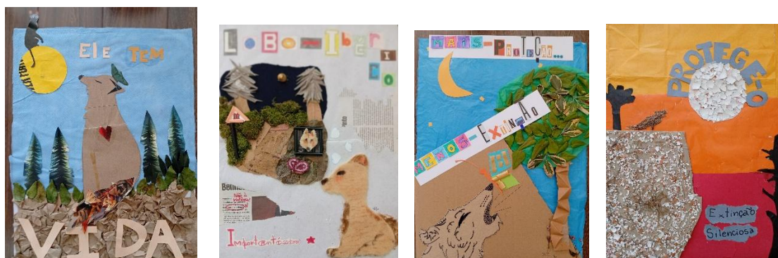
Alguns exemplos de cartazes desenvolvidos